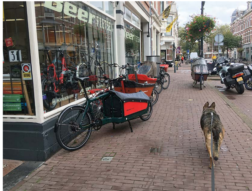
De meeste honden lopen graag met ruime afstand om spannende onbekende objecten.

Honden in de stad hebben meestal geen eigen keuzes. Voor de veiligheid is het ook belangrijk dat wij mensen onze honden goed begeleiden. Maar dan wel op een manier die past bij de natuurlijke behoeften van de hond. Kennis van de hondentaal en hun 'goede gewoontes', de set ongeschreven regels die honden onderling toepassen in hun contact, is hierbij onontbeerlijk. Op een smalle stoep loop je snel rakelings langs elkaar heen. Of je loopt met je hond pal langs een bakfiets of bouwcontainer met wapperend zeil. Vaak zijn dit spannende momenten voor een hond. Honden zijn van nature conflict vermijdend en lopen niet graag recht op elkaar of iets onbekends af. Dat kan immers een reden tot conflict zijn. Daarom benaderen ze elkaar doorgaans het liefst met een ruime boog. Maar in de stad lopen veel honden aan een te korte lijn. Ze kunnen niet zelf aangeven dat ze graag met een boogje om het spannende element heen willen lopen, dus worden ze er meestal langs geloodst.