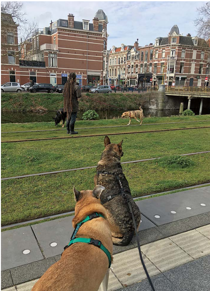
Er lopen veel mensen op de trambaan en het het perron, hier zijn veel interessante geurtjes.